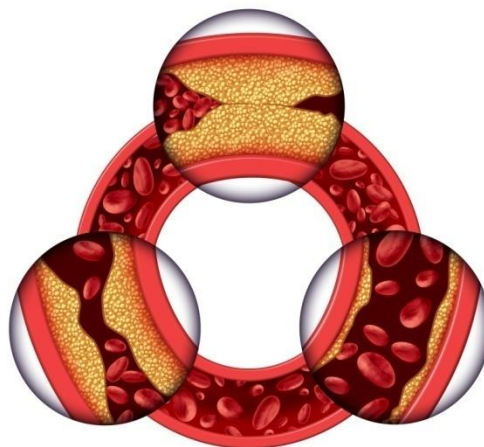
Рисунок 1. Схематическое изображение сосудов, засоренных холестериновыми бляшками

Практически каждый 7-й казахстанец имеет то или иное БСК. По данным Всемирной организации здравоохранения, в Казахстане в 2012 году 54% смертей произошло от БСК. На сегодняшний день от БСК в Казахстане ежедневно умирает около 100 человек.